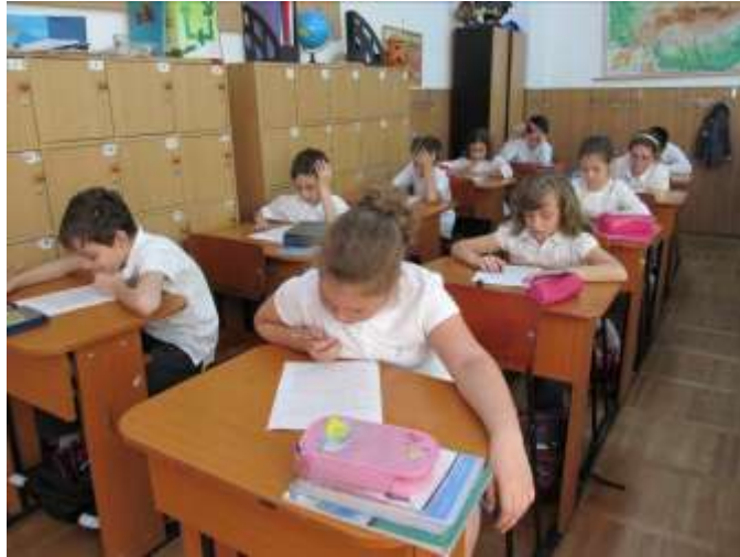
Elevii clasei a III-a citind textul