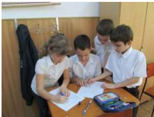
Un grup de elevi completând cadranele