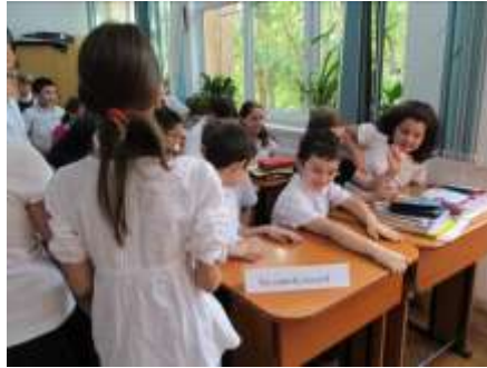
Elevii participă la procesul de intenție

Nu sunt de acord pentru că este obligată să spună ce face, ca mama să-i spună ce e bine și ce nu.