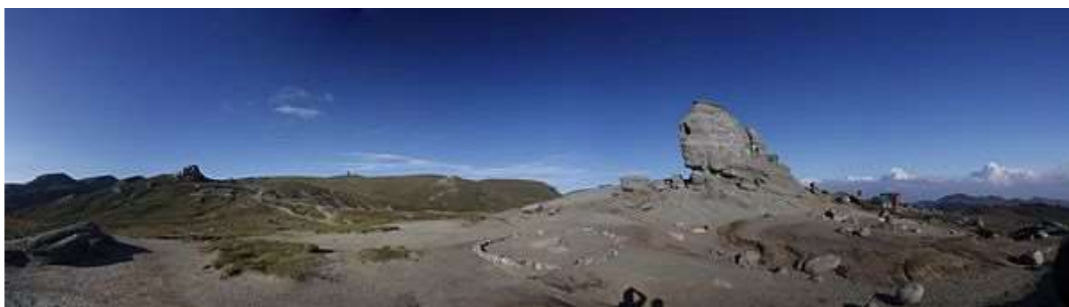
Sfinxul din Bucegi - imagine panoramică

În munții României există și alți megaliti care poartă denumirile de sfinxi: Sfinxul de la Stănișoara, Sfinxul de la Piatra Arsă, Sfinxul Lainicilor, Sfinxul Bratocei, Sfinxul Bănățean cunoscut și sub denumirea de „Sfinxul de la Topleț”, Sfinxul de la Pietrele lui Solomon etc.