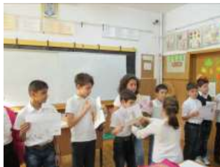
Elevii clasei a III-a explorează textul și prezintă rezultatele